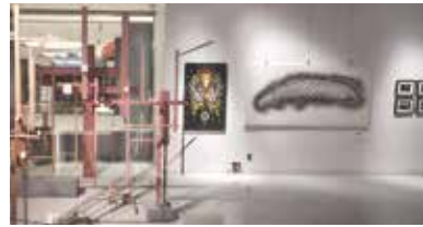
昨年の展示の様子

「LAG AWARDS」は池袋の街とアーティストをつなぐ「池袋アートギャザリング (IAG)」が企画運営する公募展です。全国からの応募者約447名の中から、現役アーティストを中心とするIAG審査員たちによってジャンルや年齢を問わず選抜された50名前後の精鋭アーティストたちが、東京芸術劇場に集結いたします!