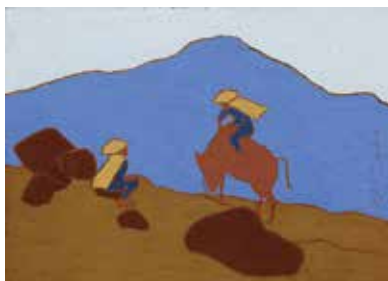
「山道」1961年 油彩/板 熊谷守一つけち記念館蔵

会期 4月16日Tue. ～6月30日Sun. 10:30～17:30 ※月曜休み