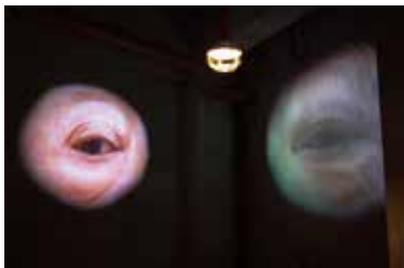
《現代:熱海鰐圖》2023