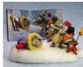
ウクライナ民話の絵本『てぶくろ』

会期 5月17日Fri.~6月2日Sun. 12:00~18:00 ※月、火、水、木、休み